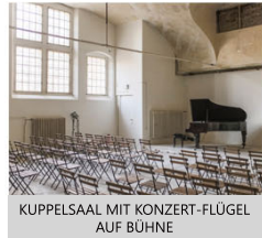
KUPPELSAAL MIT KONZERT-FLÜGEL AUF BÜHNE