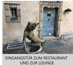
EINGANGSTÜR ZUM RESTAURANT UND ZUR LOUNGE