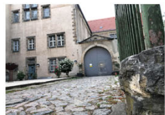
AUFFAHRT INNENHOF EHEMALIGES GEFÄNGNIS